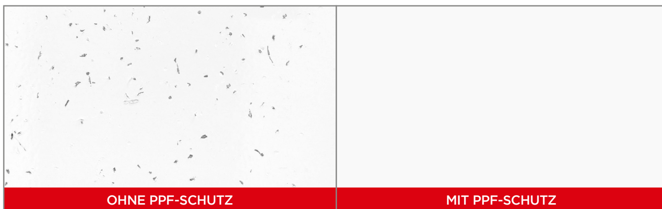
Die Abbildung zeigt einen Splittbeschuss-Test auf einer Oberfläche mit bzw. ohne installiertem PPF.

Alle hier enthaltenen Erklärungen, technischen Informationen und Empfehlungen basieren auf Prüfungen, die SunTek für zuverlässig hält. SunTek gibt keine Gewährleistung oder Garantie für die Genauigkeit oder Vollständigkeit dieser Informationen.